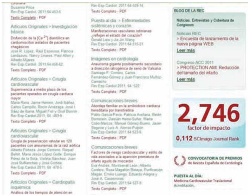
Figura 2. Ejemplo de la publicación del SCImago Journal Rank & Country en Revista Española de Cardiología.